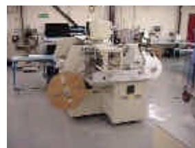
Gürtungsservice mit optischer Kontrolle